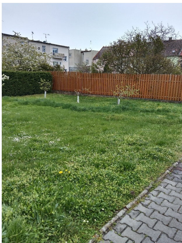
Obrázek 2 Umístění altánu pro výuku přírodních věd