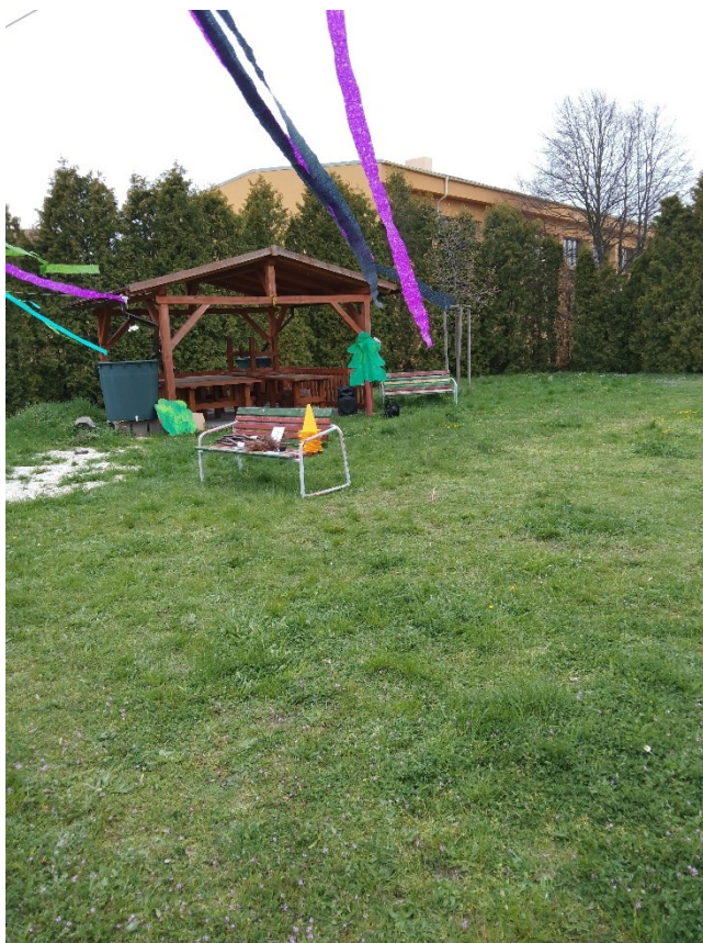
Obrázek 1 stávající altán řemesel a pěstitelských činností